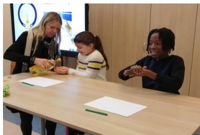
Opening thema voeding