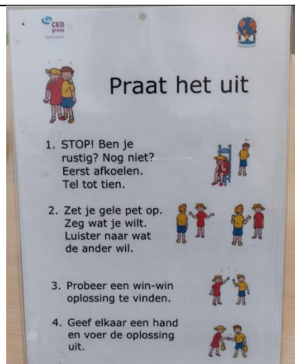
Praat het uit- kaart